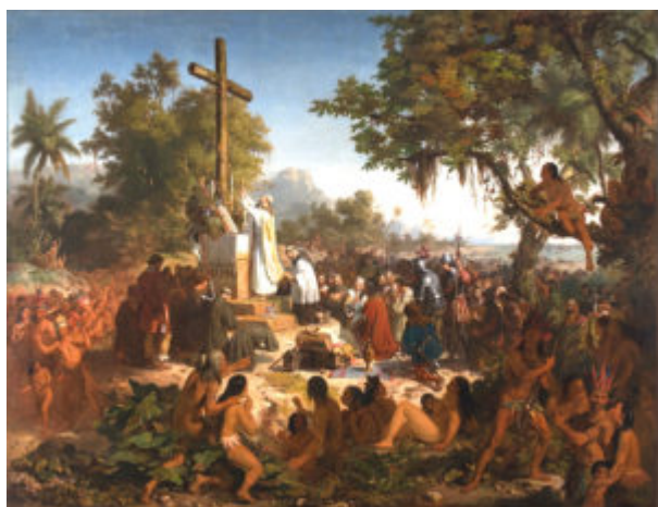
Figure 1 : Le tableau A Primeira missa no Brasil qui se trouvait au Museu Nacional de Belas Artes (MNBA) 6

Le mythe d'un Brésil idyllique – qui a occupé l'imaginaire social depuis les versions édéniques du temps des découvertes coloniales, notamment par l'intermédiaire du tableau de Meirelles 4 , A primeira missa no Brasil 5 (La première messe au Brésil) (1860) –, et celui des “stylisations pionnières tropicalisées” (Almeida Filho, 2005) ont déjà été traités à plusieurs reprises par différents auteurs et je ne reviendrai donc pas sur ce sujet. J'approfondirai plutôt ce concept en prenant la distance nécessaire pour envisager la brésilianité comme une sorte de pilier de l'identité brésilienne.