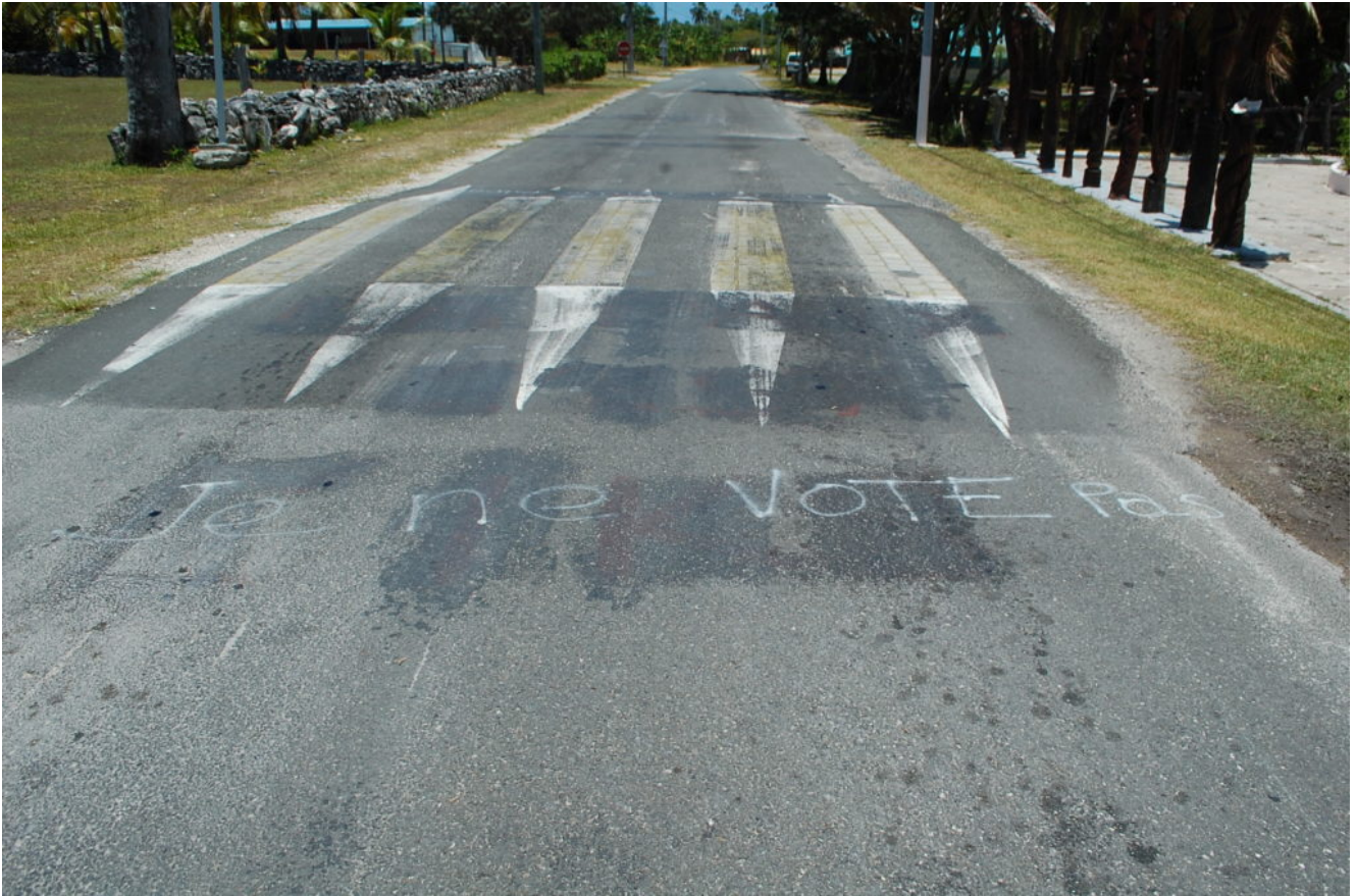
Fig. 4. Graffiti pour une non-participation au référendum, Ile d'Ouvéa, décembre 2018.