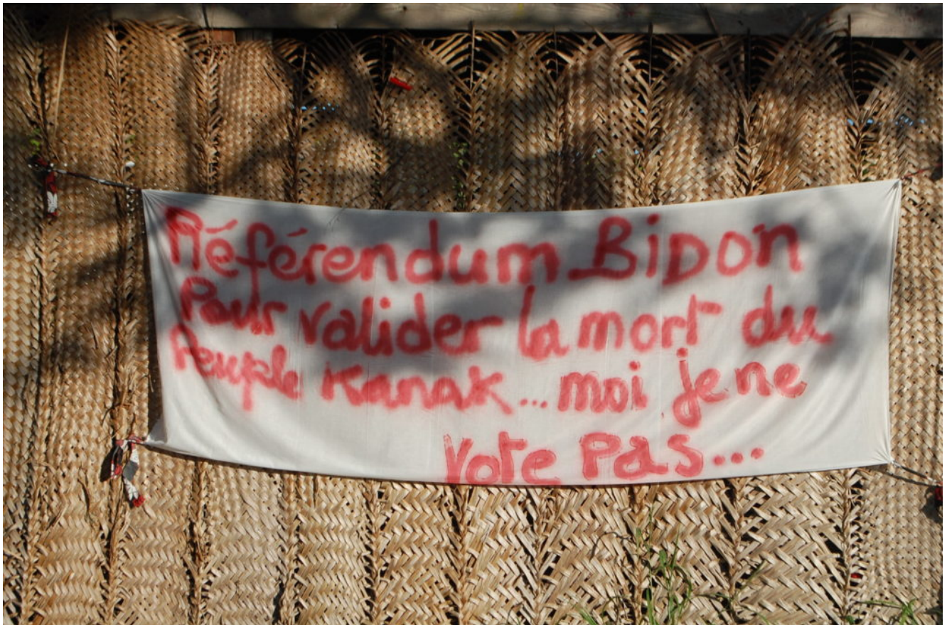
Fig. 5. Banderole appelant à la non-participation au référendum, ancienne EPK, Ile d'Ouvéa, décembre 2018.