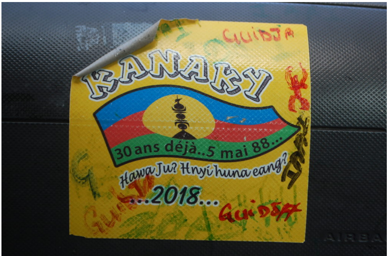
Fig. 1. Autocollant commémorant les 30 ans des événements d'Ouvéa, Ile d'Ouvéa (Kanaky), décembre 2018.

autant, cette démarche n'est pas simple et les ressorts coloniaux unissant la métropole à la collectivité sont complexes. La question se pose des suites données à la tenue des référendums successifs si ceux-ci n'aboutissent pas à l'accession à l'indépendance... Comme nous l'avons dit précédemment, certains territoires de Kanaky, les Iles Loyauté, semblent déjà y être parvenus, à en juger par la façon dont le peuple kanak se prévaut de ses terres et existe sans être invisibilisé. Comme le disent les zapatistes du Chiapas (Mexique) : « La terre appartient et appartiendra toujours à celui qui la travaille » [11] (Emiliano Zapata, 1911).